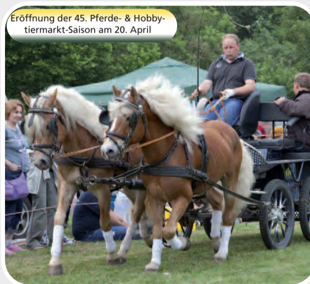
Eröffnung der 45. Pferde- & Hobbytiertag-Saison am 20. April