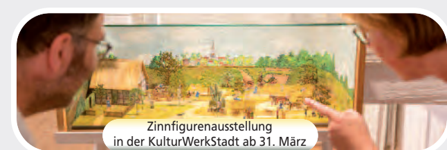
Zinnfigurenausstellung in der KulturWerkStadt ab 31. März