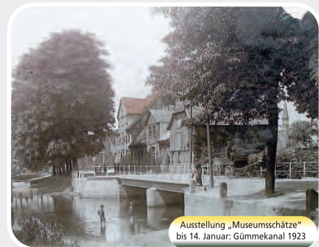
Ausstellung „Museumsschätze“ bis 14. Januar: Gümekanal 1923