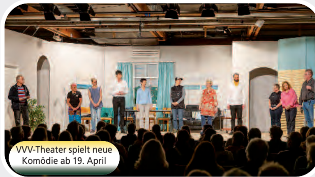
VVV-Theater spielt neue Komödie ab 19. April