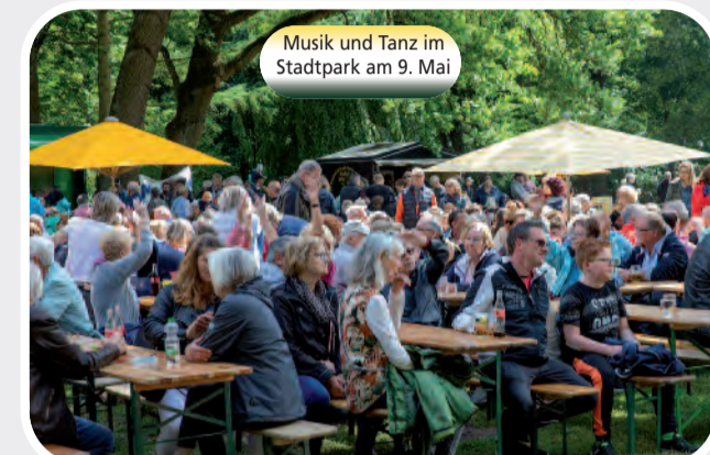
Musik und Tanz im Stadtpark am 9. Mai