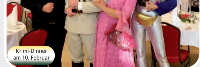
Krimi-Dinner am 10. Februar